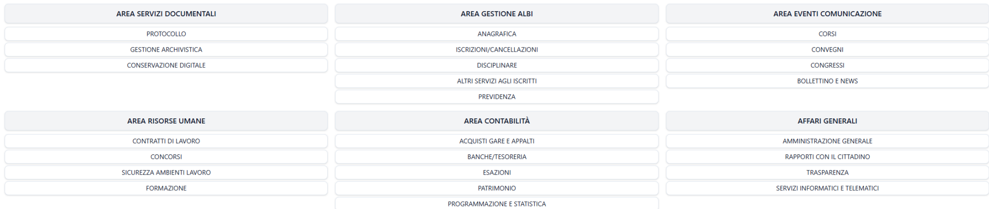
Figura n. 2